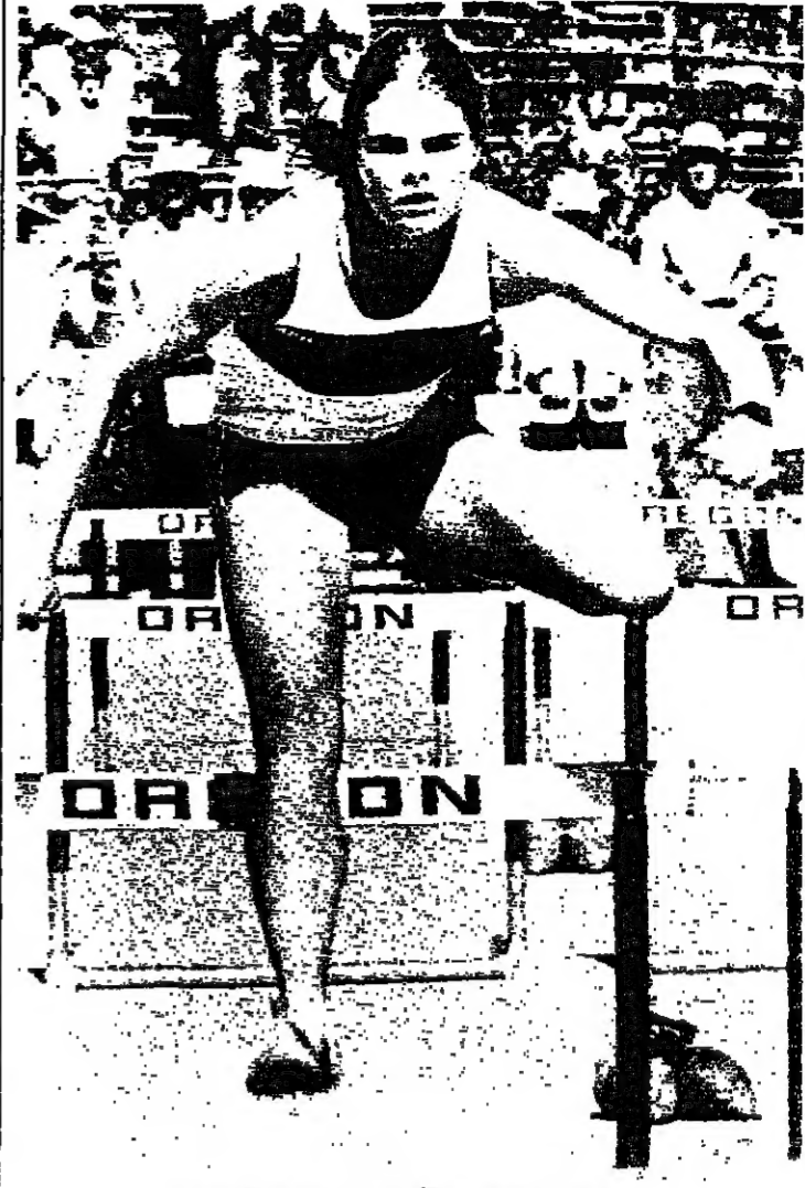
ماريل همنفاوي تقفز فوق الحواجز الولىبية

ماريل همنفاوي وبتريس دولتي... تضاعف جمالها في خدمة الرياضة، حيث العلاقات المختلفة والآراء المختلفة في قضايا إنسانية والقيم يعود إلى العام ١٩٧٦، وإلى الألعاب الولىبية تحديداً.